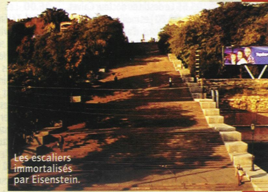
Les escaliers immémoriaux par Eisenstein.

tant de déambuler à la rencontre des marchés, du célèbre conservatoire de musique et des escaliers immortalisés par Eisenstein. C. L.