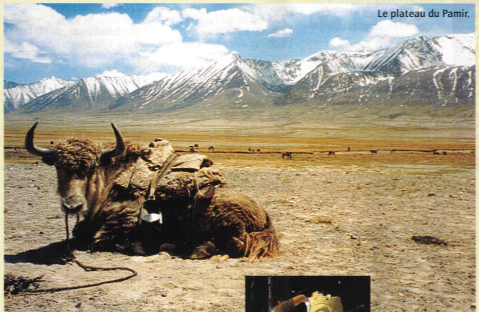
Le plateau du Pamir.

tant de déambuler à la rencontre des marchés, du célèbre conservatoire de musique et des escaliers immortalisés par Eisenstein. C. L.